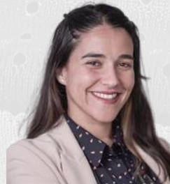
NATALIA CABRERO COMUNICACIÓN