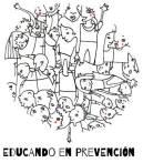
Figura del Delegado o Delegada de protección (art. 48)

Esta figura deberá ser desarrollada por la normativa autonómica, en la LOPIVI se especifica que: